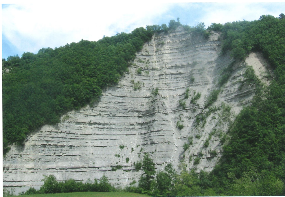
Rupe di Corneto

Rinier da Corneto fu padre del famoso capitano ghibellino Ugucione della Faggiola (1250 circa - 1319). A riprova di ciò, Emanuele Repetti cita, tra l'altro, un atto notarile del 9 dicembre 1298 con menzionati i fratelli Ugucione e Ribaldo figli del fu Ranieri della Faggiola. Localmente si narra che Dante, ospite di Ugucione della Faggiola nel castello di Corneto, sia rimasto talmente colpito dalla successione marnoso-arenacea suborizzontale, bene evidente nella rupe sottostante, da trarne l'ispirazione dei gironi infernali.