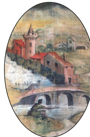
Il Castello di Corneto raffigurato in un antico dipinto conservato nella chiesa di Quarto (Sarsina)