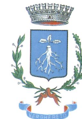
Comune di Verghereto